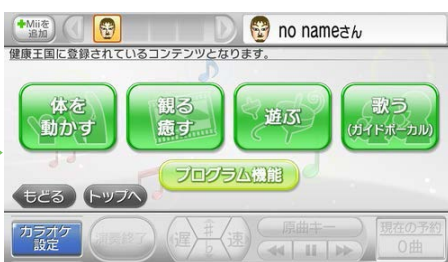
2 「体を動かす」を押します。