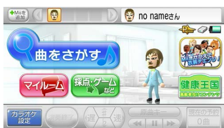
1 「健康王国」を押します。