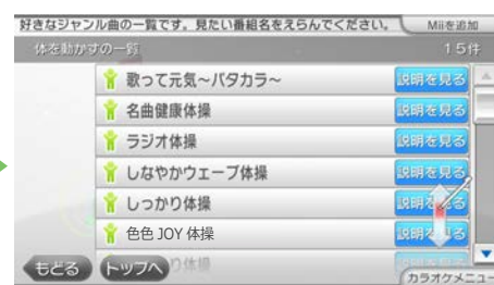
3 「色々JOY体操」を選びます。