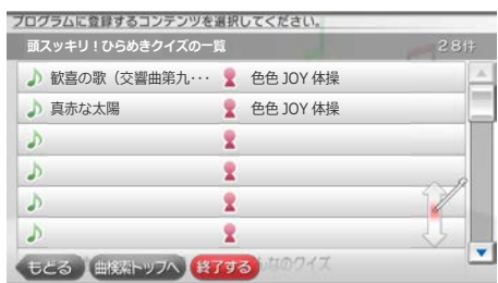
4 利用したいコンテンツを選びます。